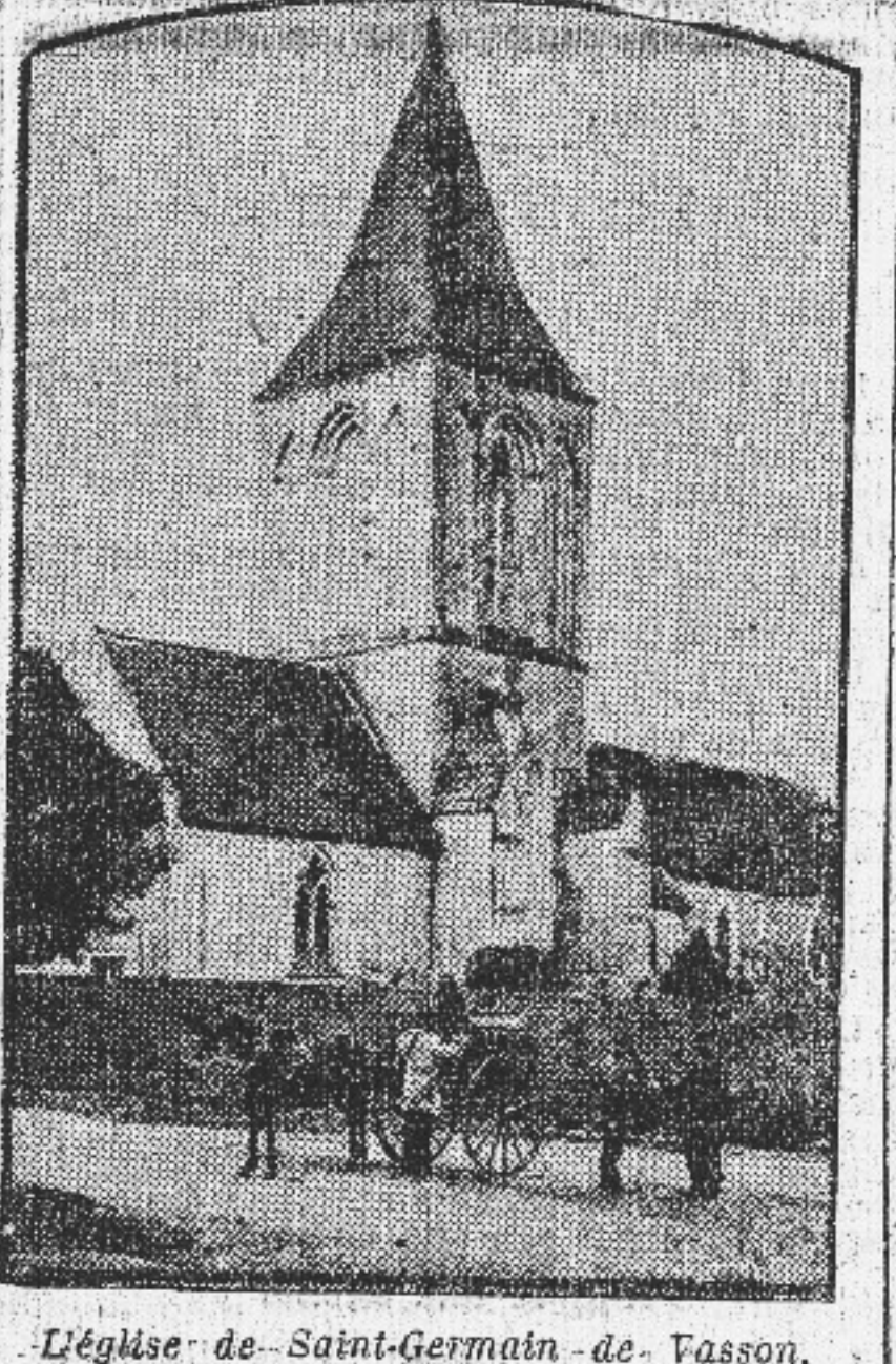
Eglise de Saint-Germain de Vasson, près Potigny.

Ils vont venir spontanément, disent-ils, sur cette terre du Calvados où la mise en exploitation des mines attire des ouvriers de toutes les nationalités.