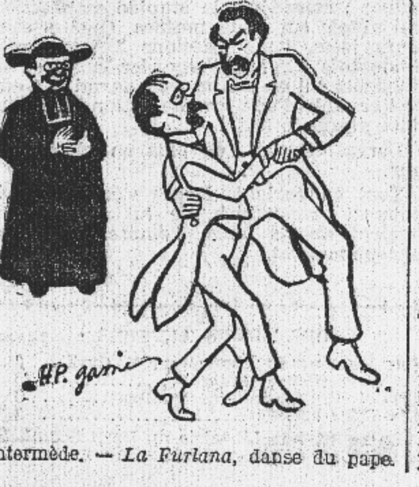
Intermède. — La Furkana, danse du pape.