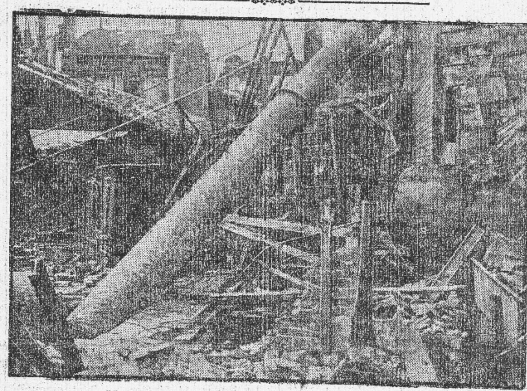
LA BLANCHISSERIE APRES L'EXPLOSION

M. Joseph Reinach s'écriait, à la séance de vendredi : « Voulez-vous donc que la campagne de presse puisse continuer ? » Et nous, nous demandons : Voulez-vous donc que le pays ignore quels sont les effets meurtriers d'une loi d'incapacité et de réaction ?